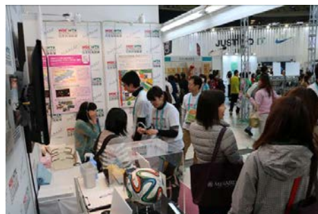
当社ブースの様子